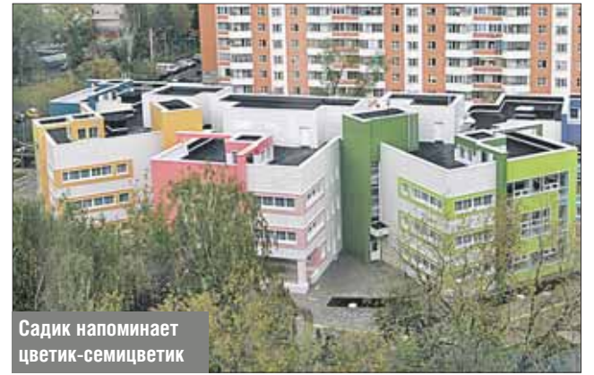
Садик напоминает цветик-семицветик

1 сентября для маленьких жителей Южного Медведкова открылись двери нового детского сада на Ясном пр., ба. Он стал структурным подразделением школы №285. Трёхэтажное здание выстроено по интересному архитектурному проекту: оно напоминает цветик-семицветик, где группы «лепестки» соединены вокруг холла. Сад оборудован