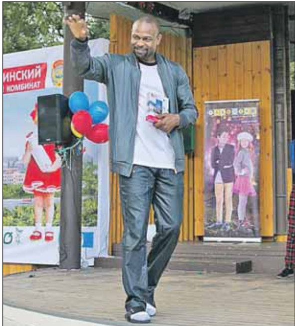
Знаменитый боксёр принял участие в фестивале