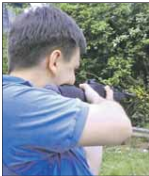
По четверногим всё чаще стреляют

Хозяйка Дымки собирается наказать обидчика своей любимицы: уж женщины есть предположение, кто стрелял, и она