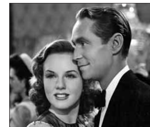
Кадр из фильма «Сестра его дворецкого»

13 сентября в 16.00 пройдёт показ французского сюр-