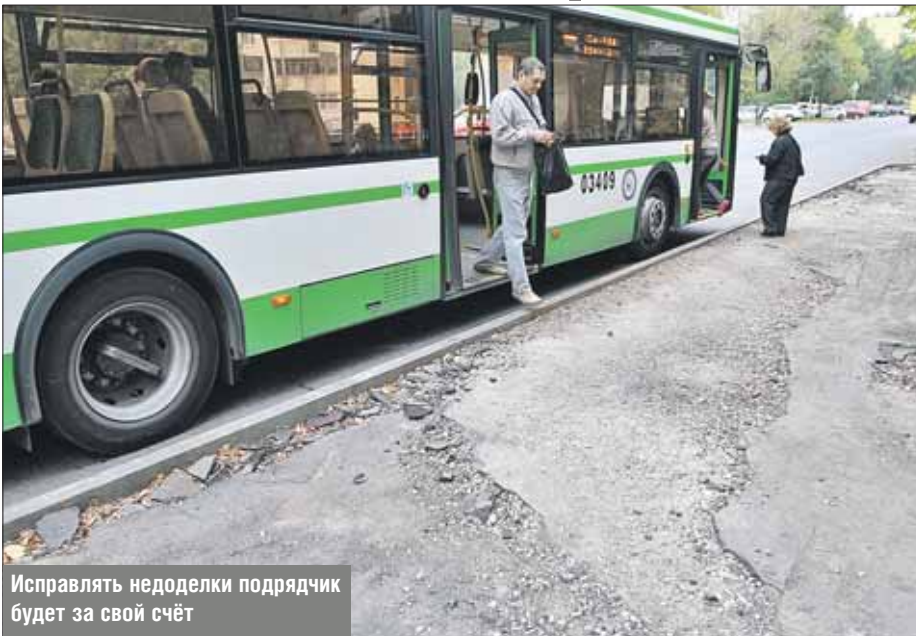
Исправлять недоделки подрядчик будет за свой счёт

— Однако в назначенные сроки компания не уложились. Более того, проверка объекта специалистами государственного админи-