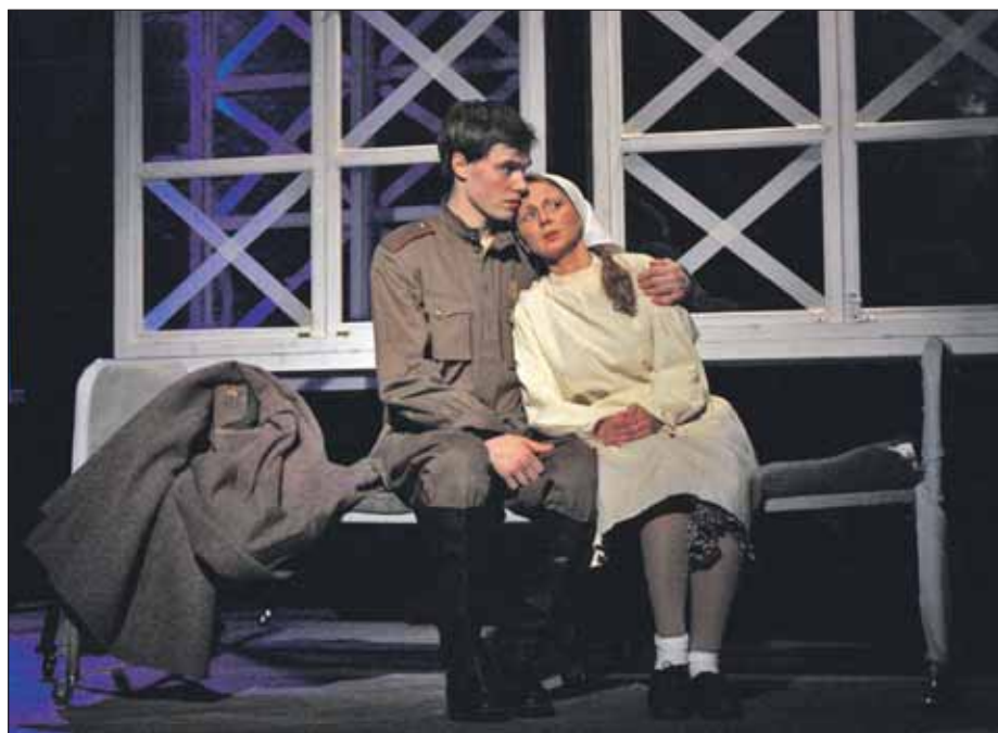
Спектакль «Звездопад» Московский государственный историко-этнографический театр поставил к 70-летию Победы

В середине сентября театральный сезон откроется в Молодёжном театре под управлением Вячеслава Спесивцева на ул. Руставели, 19. 15 сентября зрителей ждёт спектакль «Чайка по имени Джонатан Ливингстон».