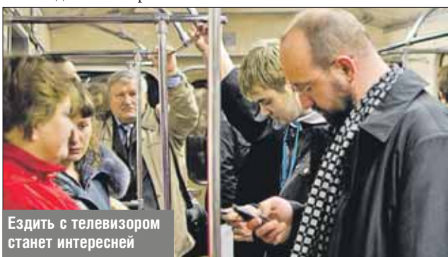
Ездить с телевизором станет интересней