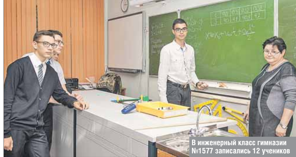
В инженерный класс гимназии №1577 записались 12 учеников

Пока в только что открывшемся здесь инженерном классе 12 учеников. Боль-