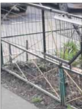
Садовод вырвал урну, чтобы сделать палисадник

Занимательная история с садоводом, не любящим урны, случилась во дворе на Анадырском пр., 69. Житель дома написал на портал «Наш город»: «У нашего 6-го подъезда один садовод-любитель, города какуо-то изгородь, взял, оторвал урну и выбросил. Надо его обязать восстановить её». На прикреплённом фото действительно было запечатлено некое сооружение в палисаднике на месте, где обычно устанавливают урны. Через 10 дней коммунальщики восстановили урну внутри палисадника рядом с цветочной композицией, которую к тому времени уже оформил тот самый «садовод-любитель». Однако ещё через три дня урна была снова сломана — по сообщению пользовате-