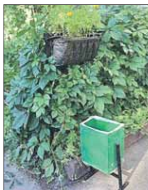
Урна на новом месте

ля портала, всё тем же садоводом. Ещё через 10 дней в управе Лосиноостровского района сообщили: «В связи с неоднократными вандальными действиями по удалению урны, установленной около цветника, организованного силами жителей, было принято реше-