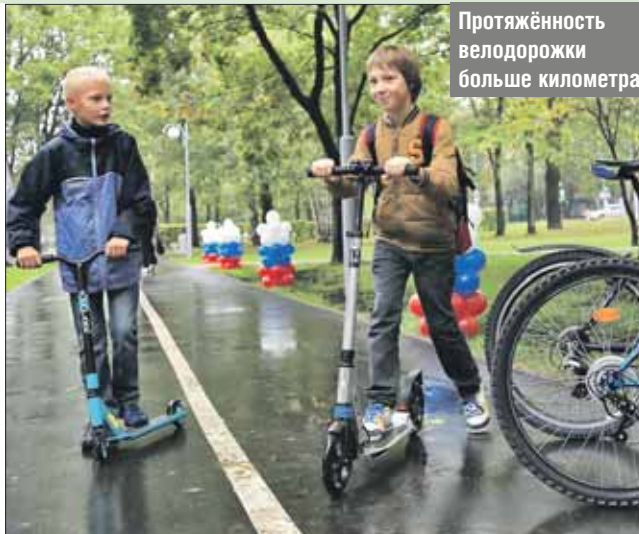
Протяжённость велодорожки больше километра

— Нашей дружбе с Москвой уже много лет. Власти столицы, все префектуры всегда оказывали помощь Севастополю и Черноморскому флоту, поддерживали добрые, хорошие отноше-