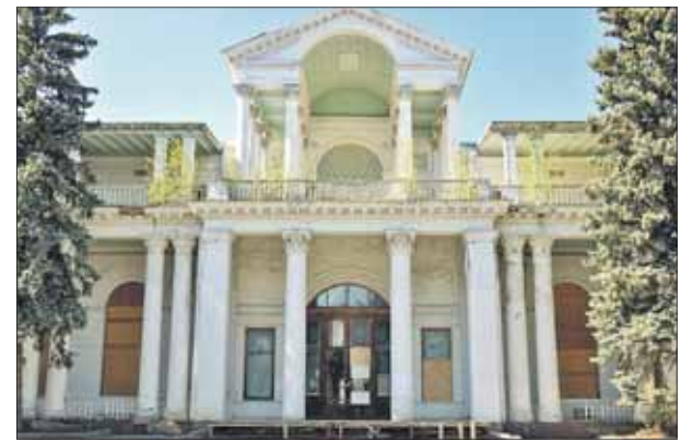
Сейчас ресторан требует масштабных восстановительных работ

— Сейчас ресторан требует масштабных и дорогостоящих восстановительных работ, поэтому и выставлен на аукцион по льготной ставке аренды — 1 рубль за 1 кв. метр в год, — пояснили «ЗБ» в пресс-службе Департамента по конкурентной политике Москвы. — Но есть и два условия. Первое — основное назначение объекта остаётся прежним, открывать там магазин будет нельзя. Второе — льготная