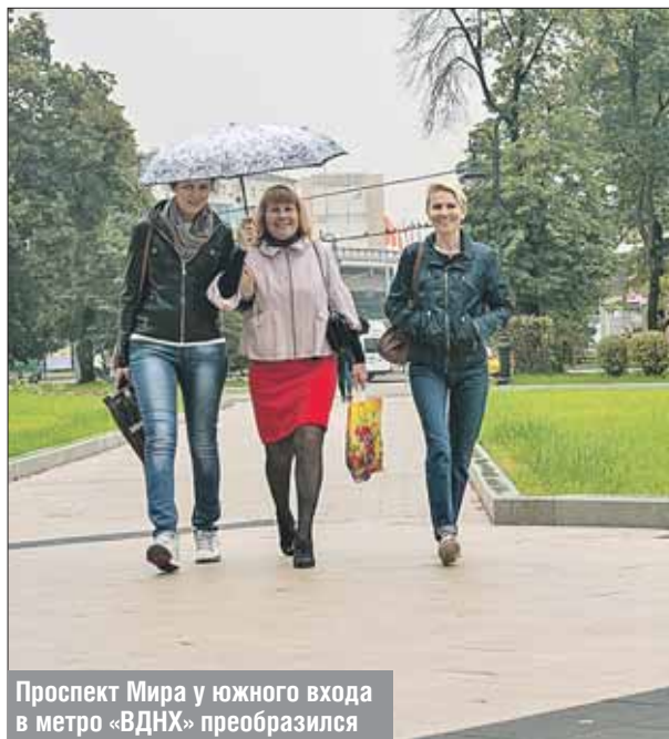
Проспект Мира у южного входа в метро «ВДНХ» преобразился

Возле южного выхода из метро «ВДНХ» изменения сразу заметны. Тротуар вымощен светло-серой плиткой, установлен новенький туалет, на проезжей части