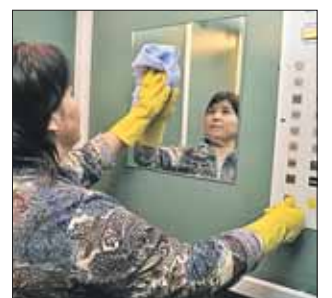
Новые модели оборудованы зеркальной вставкой

Кабины новых моделей оборудованы зеркальной вставкой и металлическими панелями с порошковым напылением бело-бежевых тонов. Кнопки вызова этажей снабжены символами азбуки Брайля. Для удобства маломобильных жителей в кабине устанавливаются металлические поручни. По словам специалистов ЩЛЗ, после установки новых лифтов в квартирах дома будет гораздо тише благодаря высокому уровню шумо- и звукоизоляции кабины лифта. Также с новым современным приводом створки нового лифта будут открываться и закрываться тихо, без хлопков.